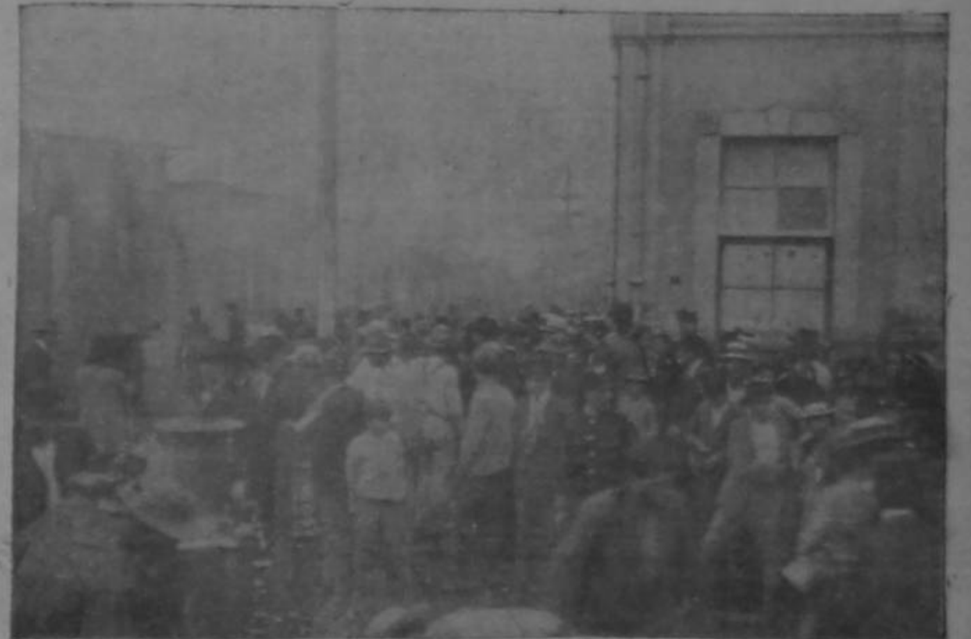
El público en el lugar del incendio.